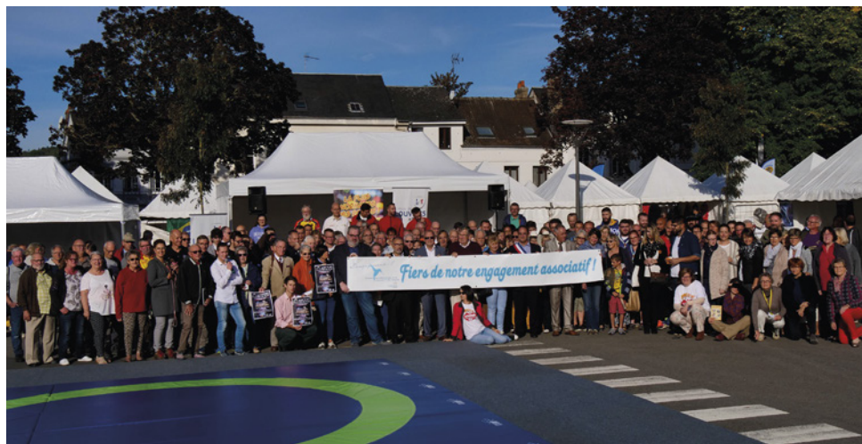
Village des associations – Place de la république – Louviers 2018